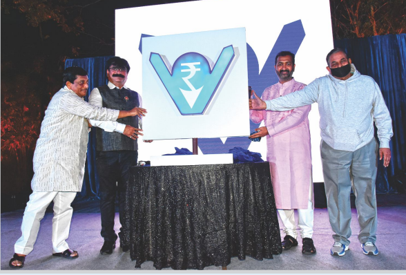
बँकेच्या नवीन बोधचिन्हाचे अनावरण मा. संचालक मंडळातर्फे करण्यात आले.