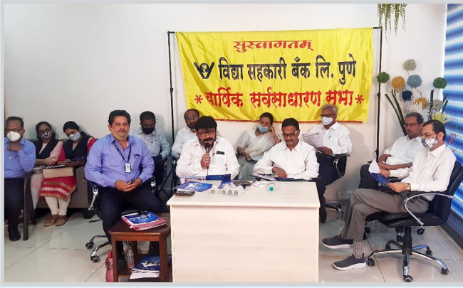
कोविड-१९च्या पार्श्वभूमीवर गेल्या वर्षीची वार्षिक सर्वसाधारण सभा Video Conferencing द्वारे आयोजित करण्यात आली.