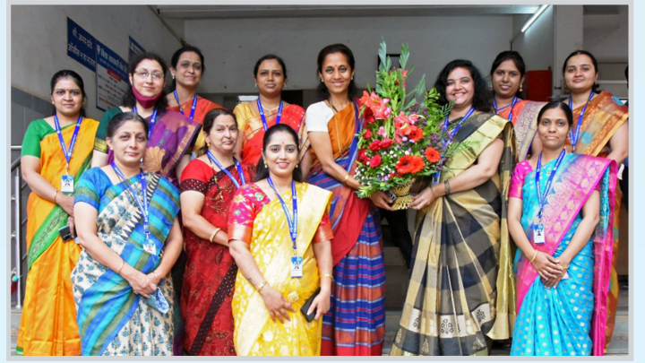
मा. खासदार सुप्रियाताई सुळे यांची बँकेस सदिच्छा भेट!